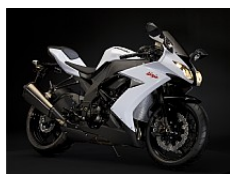
Blanc Pearl Stardust