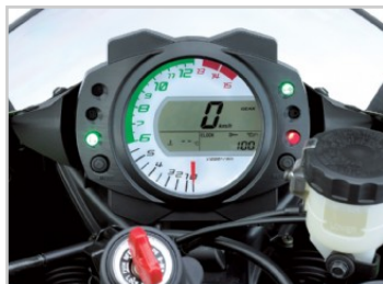
Tableau de bord à affichage mixte