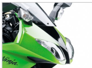
Modification du Ram Air