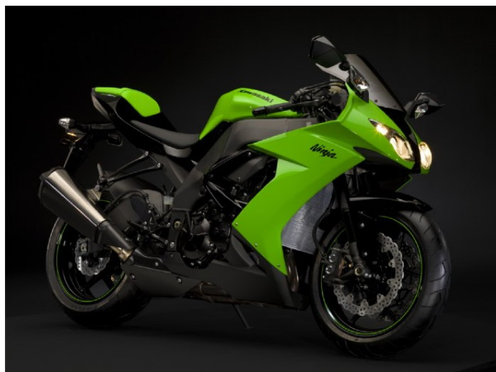
Année modèle 2009