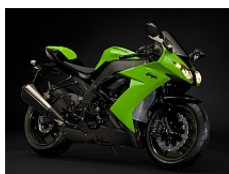
Vert Lime Green